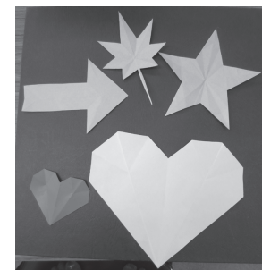
簡単なものから複雑なものまで、ひと裁ち折りの世界は多種多様です。

「2、3歳の幼児からお年寄りまで、誰でもが楽しめます。折り回数を少なくして、できるだけシンプルに設計するのが肝心です」。