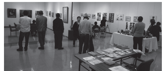
多彩な作品に加えて、紙芝居とひと裁ち折りの実演が会場を盛り上げました。

隣室でも絵画展が行われていましたが、建築ネットの会場を覗いた隣室の来場者は「楽しくてドキドキする」。いずれも一生懸命取り組んで出品にこぎつけた作品ばかり。個性が集積した文化・美術展となりました。同展は2年に一度。次回は2016年の開催を計画しています。